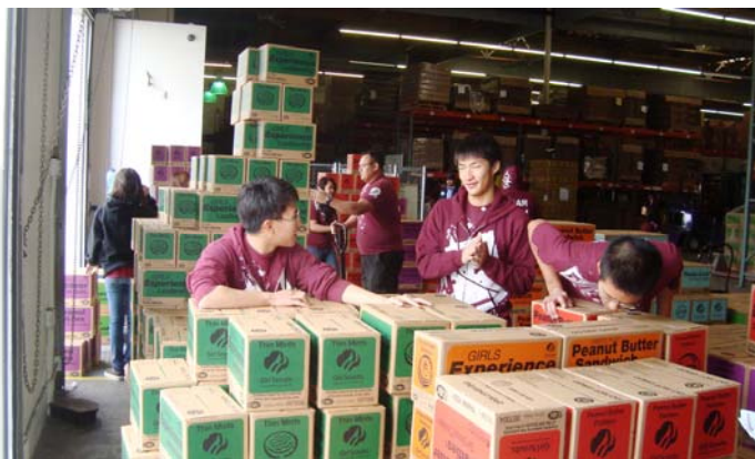
Thanh sinh Thanh đoàn Lê Lai giúp phân phối Girl Scouts Cookie đến các đơn vị trong Service Unit