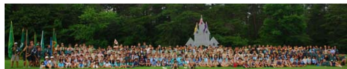
Trại Lửa Việt 8 Miền Đông Hoa Kỳ