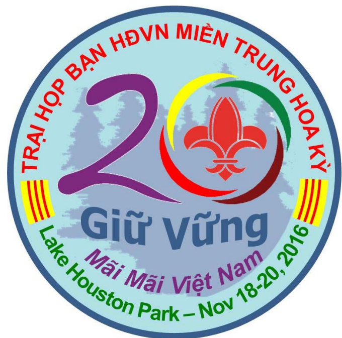
Huy hiệu Trại Giữ Vững XX