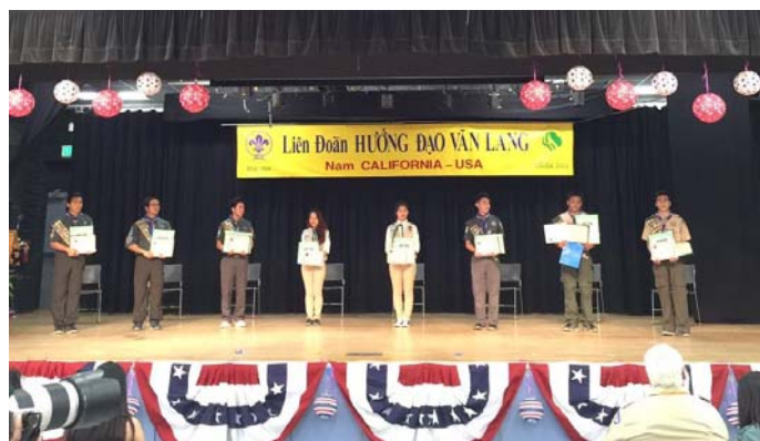
Lễ Trao Đăng thứ của Liên Đoàn Văn Lang Nam Cali