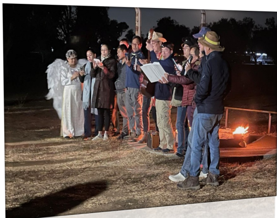
Bản Tin Cờ Lau 86

Bên cạnh đó, các Ngành cũng đã tổ chức các lễ tuyên hứa riêng từng ngành vào sáng chủ nhật trước khi nhò trại.